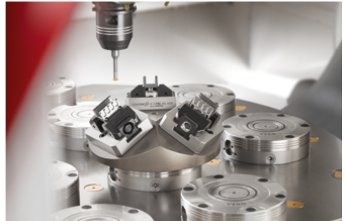
Spårfräsning med hjälp av TENDO E compact